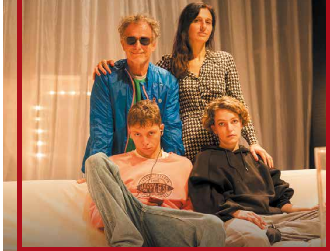
© V. Berenger - Châteauneuf-Liberté - SN/T. Kyriakidou / V. Beaume / N. Houguena / K. Nio / J. Helaine