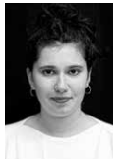
Ève Pereur Princesse