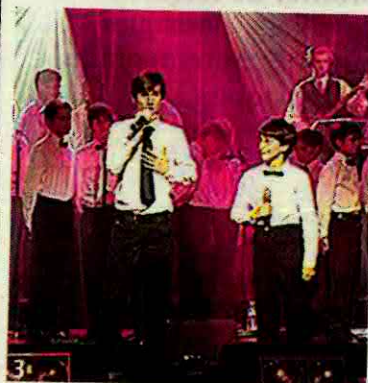
Le Quartz table sur le burlesque, cette semaine, avec la pièce de théâtre « Bigre ! » (1), alors que la Carène et l'Avel-Vor jouent la carte musicale à fond avec, respectivement, les Challenges musicaux (2) et un concert choral avec les Poppy's d'Asnières (3).

On a beau chercher, impossible de trouver un vrai fil conducteur entre les trois rendez-vous sélectionnés cette semaine. À part un, peut-être : ils méritent tous le déplacement.